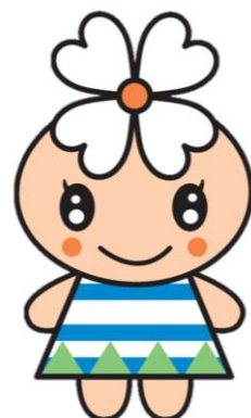
社協キャラクター ココロちゃん

また、災害時には、全国の社会福祉協議会から、災害支援に駆けつけて活動しています。