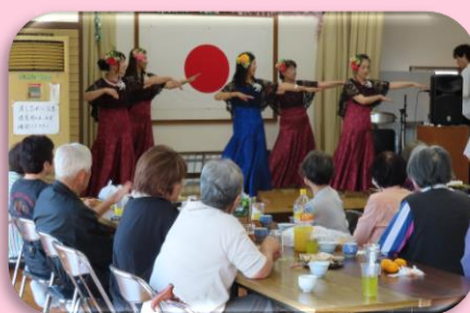
ボランティアの活動支援