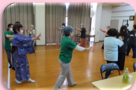
ふれあいいきいきサロン・ 見守り活動 (行政区福祉会への支援)

～ ご協力いただいた社協会費の使い道 ～ 新宮町の地域に還元できる事業に活用しています。