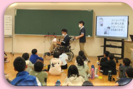
ふくし体験学習 (車いす体験・認知症学習 など)