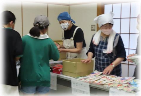
（ボランティア講座）