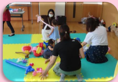
子育てサロン (行政区福祉会への支援)