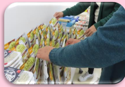
生活困窮者を支援