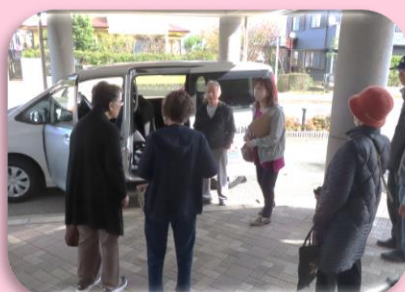
買い物サポートのための 8人乗りワゴン車の貸出し (行政区福祉会への支援)