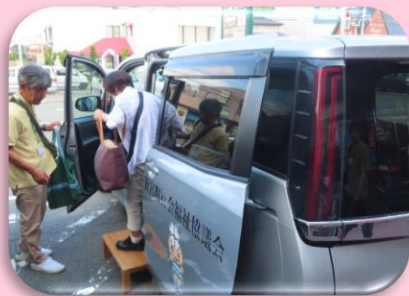
買い物サポートのための 8人乗りワゴン車の貸し出し (行政区福祉会への支援)

～ ご協力いただいた社協会費の使い道 ～ 新宮町の地域に還元できる事業に活用しています。