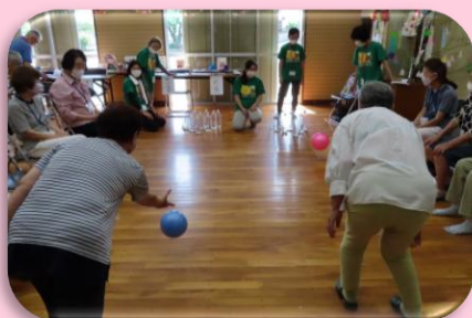
サロン・見守り活動 (行政区福祉会への支援)