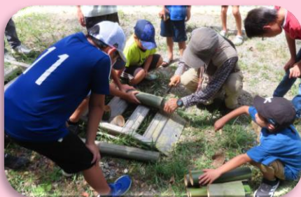
ボランティアの活動支援