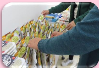
生活困窮者を支援