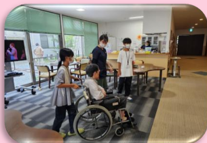
夏のわくわくチャレンジ (ボランティア参加推進)