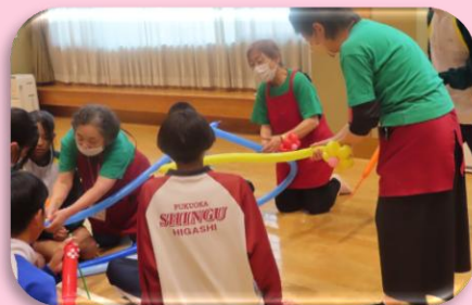
ふくし体験学習 (車いす体験・認知症学習など)