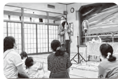
ヘアアレンジ講習会 (特技ボランティア、社会貢献活動)