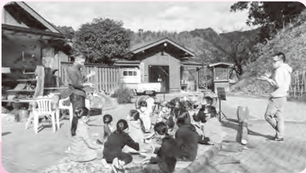
町全体や地域の福祉活動を応援 ボランティア活動