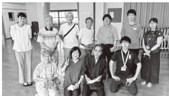
ココロちゃん班メンバーで集合写真

※第1層協議体「しんぐるっと」は、地域づくりに関心のある人なら誰でも参加することができます。参加を希望する人はお気軽にお問い合わせください。