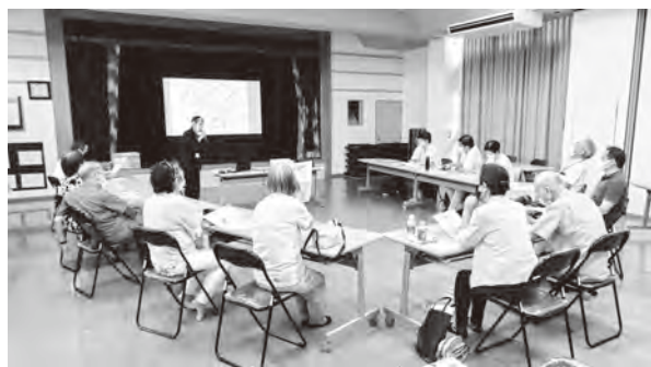
夜臼は昔、海だった!?などいろんな話がありました。

今回、検証のために場所の提供や周知などにご協力いただいた夜臼1区長の皆さまをはじめ当日ご参加された皆さま、ありがとうございました。