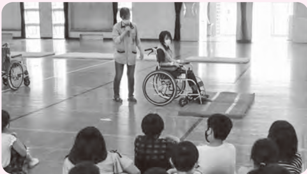
思いやりの心をはぐくむ福祉体験学習