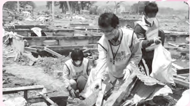
福岡県域の福祉活動や災害時の支援などに

笑顔のあふれる新宮町を目指して、赤い羽根共同募金でいろいろな道具をそろえることができました!