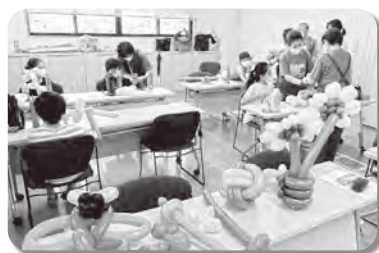
バルーンアート (福祉ボランティア団体)