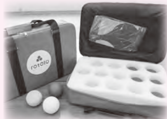
○ボッチャ スポーツを通して障がいのある人と交流ができるように。