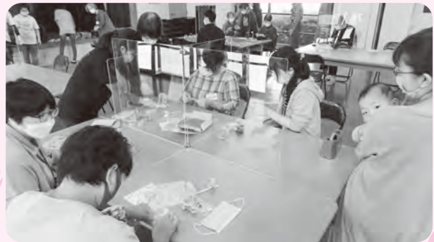
居場所づくり・生きがいづくり・健康づくり 地域サロン