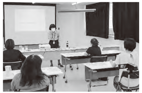
まかせて会員養成講座 (子どもを預かる心構えを学びます)