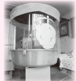
○わたがし機 地域交流などイベントにどうぞ。