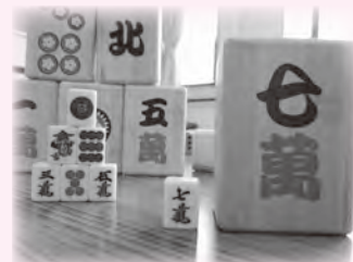
○コミュニケーション麻雀 チームになってコミュニケーションや頭の体操にも。