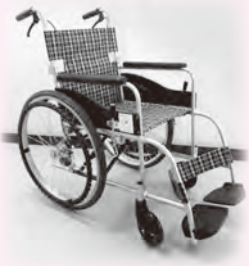
○車いす ケガしたときや介護が必要になったときでも安心して出かけられるように。

笑顔のあふれる新宮町を目指して、赤い羽根共同募金でいろいろな道具をそろえることができました!