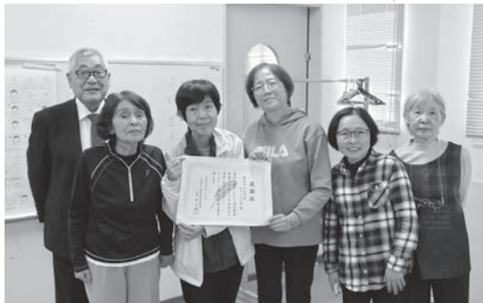
手話会のみなさま

手話の会の皆さまは、地域での福祉ボランティア活動やふくし学習でゲストティーチャーとしての協力など多岐にわたり活躍されています。