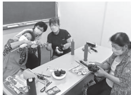
ボランティアの活動支援