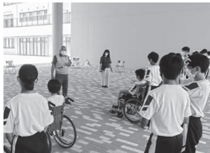
ふくし体験学習 （車いす体験・認知症学習など）