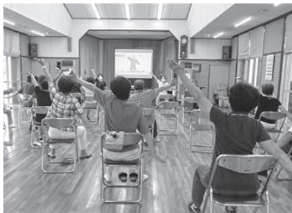
行政区福祉会への支援 （地域サロン・買い物サポートなど）