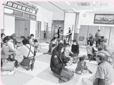
行政区福祉会活動への支援