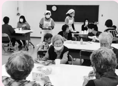
すいすいクラブ（傾聴カフェ）