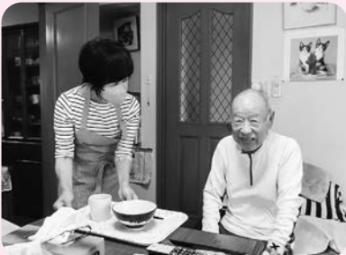
訪問介護事業（ホームヘルパー）