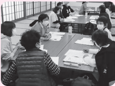
福祉委員研修会（福祉のまちづくり研修）