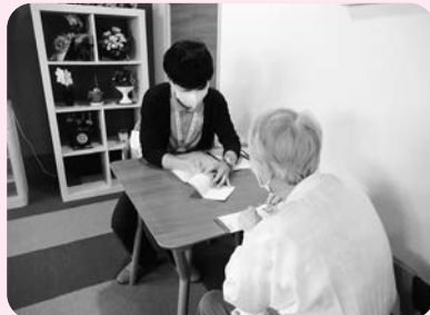
福祉サービスの利用・金銭管理支援