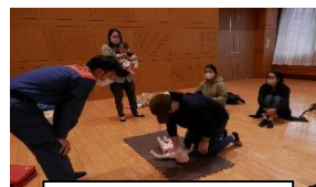
小児救急法講習会