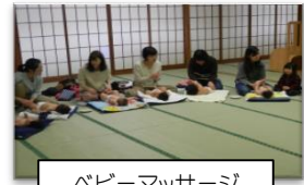
ベビーマッサージ