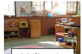
ままごとコーナー