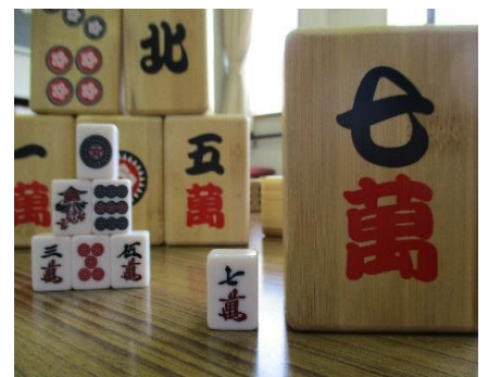
③コミュニケーション麻雀 1セット