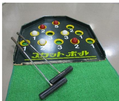
②スコットボール 2セット