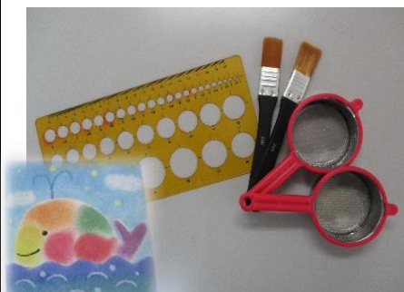
⑯パステルアート 網11, ハケ11, プレート5