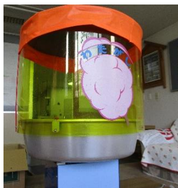
⑰わたがし機 2セット