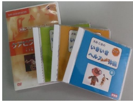
⑧健康体操DVD①～⑤ 5枚 (1枚ずつの貸出可)