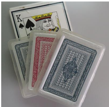
⑬トランプ11セット+大1つ