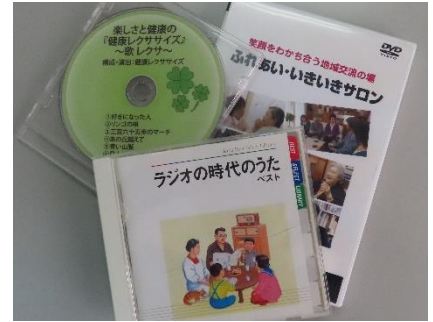
⑨その他DVD、CD (1枚ずつの貸出可)