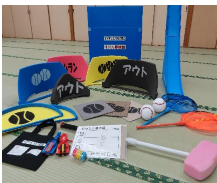
④リアル野球盤 1セット