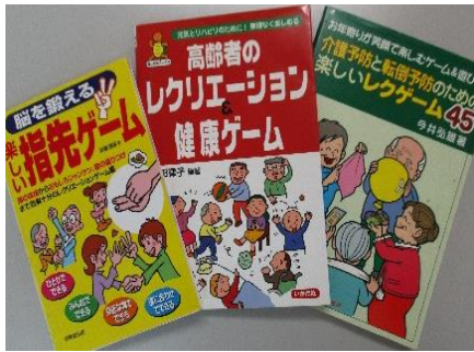
⑦レク本 3冊 (1冊ずつの貸出可)