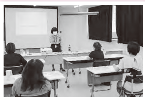
まかせて会員養成講座 (子どもを預かる心構えを学びます)

【まかせて・どっちも会員の対象】 町内に在住し、心身ともに健康で自宅で安全に子どもを預かることができる人 年齢・性別・資格は問いません。