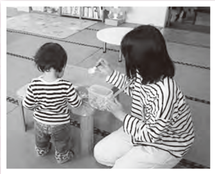
お預かり (かんがるーひろばでも預かりできます。)

周りに頼る人がいなくて困っていませんか？ 【おねがい会員登録講習】のお知らせ 送迎や預かりなどをお願いしたい人の登録講習は随時受け付けています。 電話か窓口で事前に予約をお願いします♪ 対象 ：町内に住または勤務で、生後6か月から小学校6年生までのお父さんがいる人 場所 ：町福祉センター（お父さんと一緒に受講できます。） 時間 ：午前9：00～午後3：00の間で1時間程度