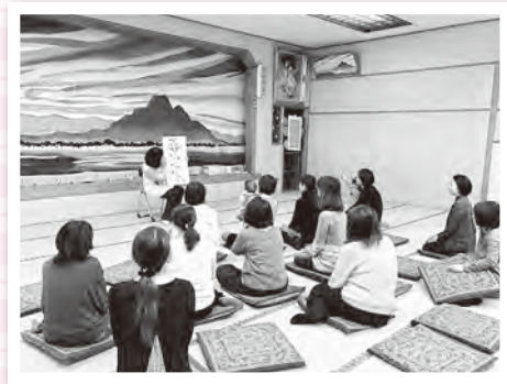
交流会 (年に2回イベントを行っています。)