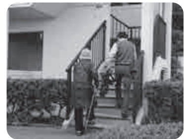
帰りは助っ人さんが 自宅までお手伝いします!