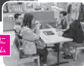
買い物の合間に コーヒータイム