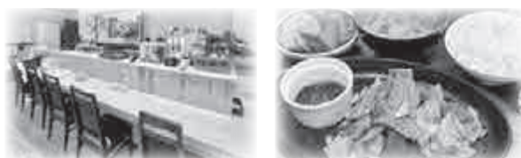
喫茶・軽食のお店 Mint (ミント) 新宮町下府 4-2-1

楽しい雰囲気なお店で、明るく気さくな従業員さんが出迎えてくれる地元にも愛されるお店です。気軽に寄ってください。