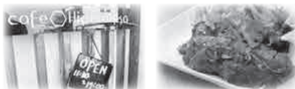
Café Higorokka (カフェ ヒゴロッカ) 新宮町上府 889-9

福岡県が推進する野菜たっぷりのランチとデザートでゆっくりくつろげる店です。東京インテリア近くです。(徒歩5分)