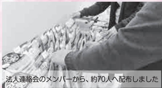
法人連絡会のメンバーから、約70人へ配布しました