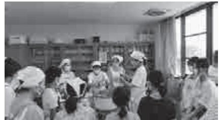
ボランティアの活動支援