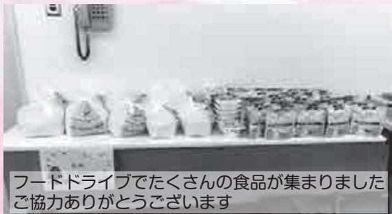
フードドライブでたくさんの食品が集まりました ご協力ありがとうございます