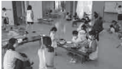
ふくし体験学習 （車いす体験・子ども理解学習など）