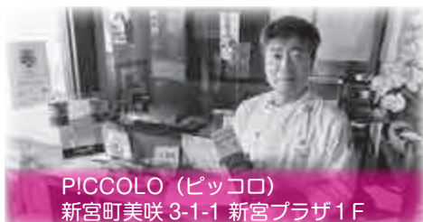
PICCOLO (ピッコロ) 新宮町美咲 3-1-1 新宮プラザ1F

こだわりワインとイタリア料理のお店です。 陽気なシェフとお食事・・・楽しいひと時をお過ごしください。 シェフの温かい人柄と石釜風のこだわりピザは別格!!