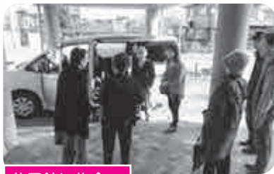
公民館に集合 みんなで出発!!

買い物支援のお知らせ文書を、65歳以上の人がある世帯全てにポスティングしました。特に気になる世帯へは民生・児童委員、福祉委員の2人で直接伺い、説明して渡しました。