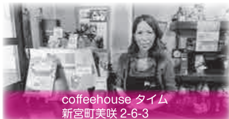
coffeehouse タイム 新宮町美咲 2-6-3

昭和 56 年に創業のサイフォンコーヒーと手作り料理を楽しめるフルサービス純喫茶です。