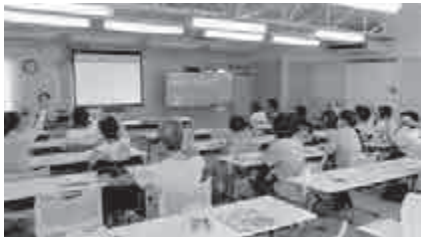
行政区福祉会への支援 （地域サロン・買い物サポートなど）